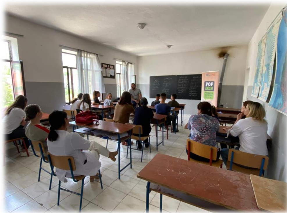
Foto nga takimet me komunitetin