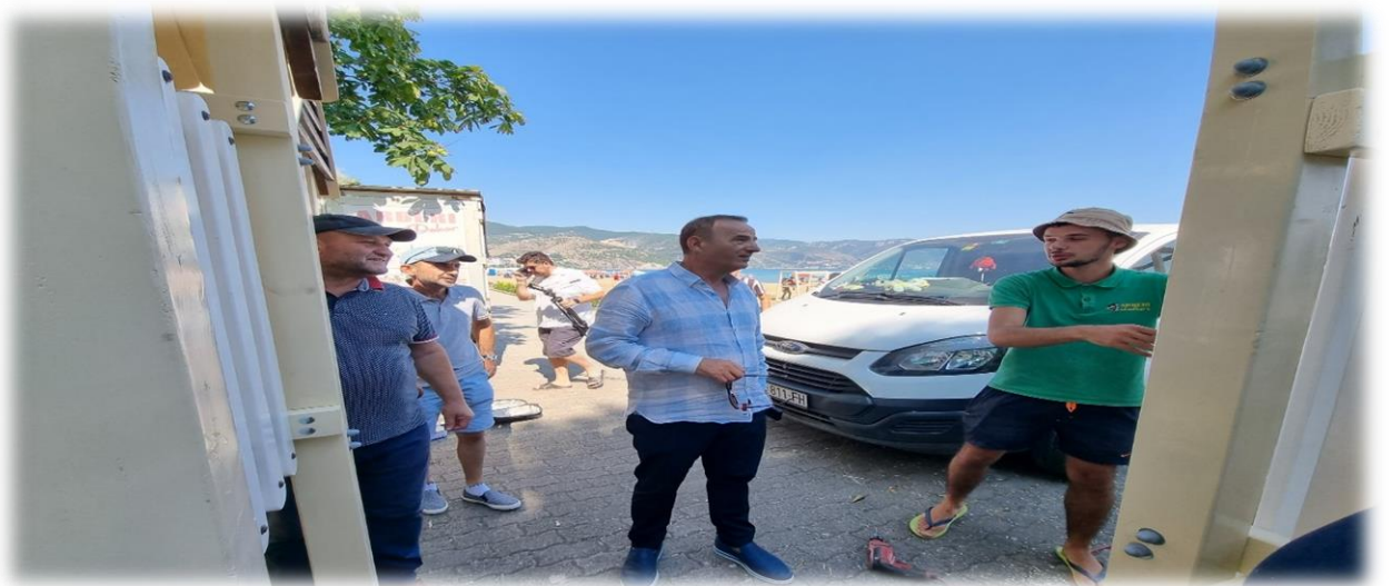
Foto nga punimet per Këndin e ri te Lojrave postuar ne faqen zyrtare te Bashkise Pogradec

Prioritet 7: Zhvillimi i programeve në lidhje me nxitjen e biznesit nga të rinjtë dhe/ose gratë. Parashikimi në buxhet për krijimin e një fondi “start-up” për të rinjtë.